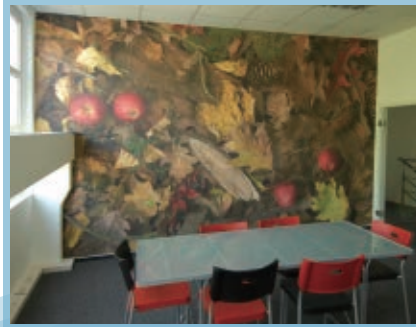
●室內用防焰的壁紙, 也是輸出材, 可以客製化製作喔!!