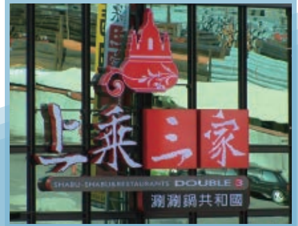
●原來這叫仟納論, 是如何製作的呢??