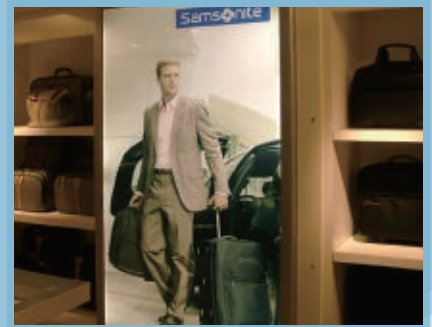
●超薄燈箱如何做到這麼薄呢??