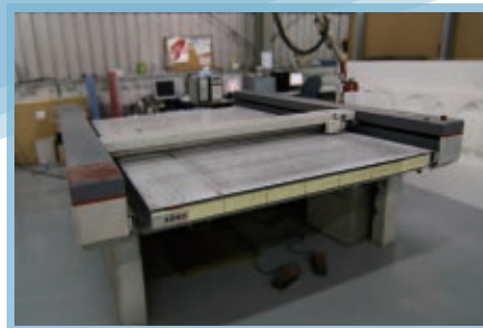
◆多功能平台切割機