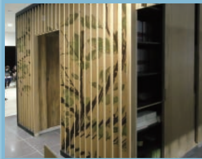
●木頭也可以當板材噴墨耶~