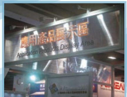
●可當輸出材也可用於裝飾的中空板, 活用在各種造型設計。