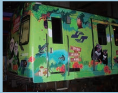
●車體如何貼膜? 用什麼材質??