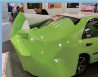
●車體膠膜仿烤漆效果。