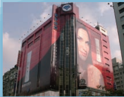
●可由室內看見樓外景觀耶~ 大樓外牆如何施工? 用什麼材質呢??